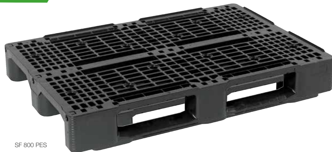
SF 800 PES