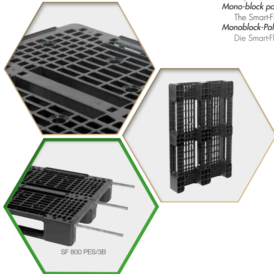
SF 800 PES/3B

Die Smart-Flow Palette wird in einem Stück gespritzt.